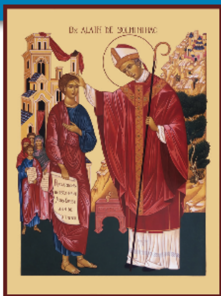
Icône écrite par Véronique Vié : artdelicone.fr

Dieu veut combler ceux qu'il a choisis pour être ses amis, connaître la volonté de Dieu et être associés à sa Mission.