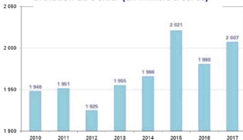
Evolution du Denier (en milliers d'euros)