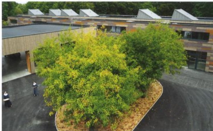
Cour du secondaire côté sud - préau, bâtiment principal et puits de lumière

Le 26 juillet 2018, après un labeur acharné en équipe, les bâtiments ont pu ouvrir leurs portes à la Commission de Sécurité venue inspecter les locaux avant l'ouverture aux élèves. La conclusion nous réjouit : Avis favo-