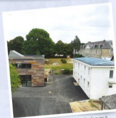
Le nouveau bâtiment, le bâtiment à rénover à droite au premier plan, la maison des Mères à l'arrière

Achevant ce qui a été construit, réparant ce qui devait l'être en priorité, il nous faut nous occuper de la réhabilitation du bâtiment blanc (voir photo ci-contre) jouxtant l'école, qui doit être mis aux normes ERP (Établissement Recevant du Public) afin de le dédier à un petit pensionnat et une hôtellerie, voire de nouvelles salles nécessaires pour la vie scolaire.