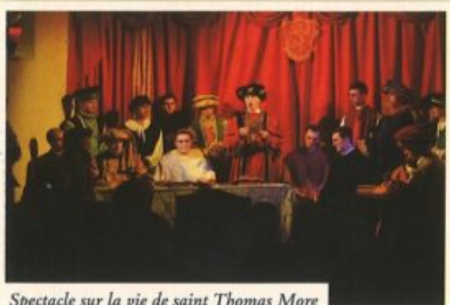
Spectacle sur la vie de saint Thomas More

S I NOËL EST ENCORE une fête si populaire dans notre société déchristianisée, c'est parce qu'elle évoque à tous la douceur, l'enfance, la paix. Nous pourrions dire que Noël est la fête de l'Incarnation rendue visible aux yeux de tous les hommes.