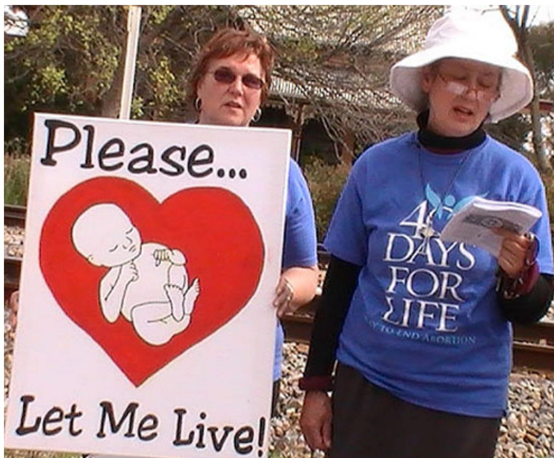
Deux photos de la vigile à Belfast (Ulster).