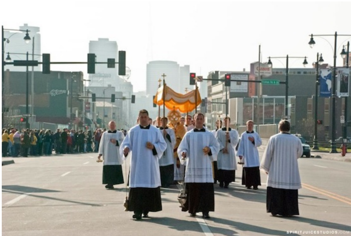
Le Saint-Sacrement arrive à l' Indiana Convention Center .