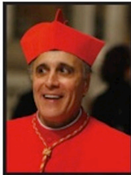
Daniel Nicholas DiNardo , archbishop of Galveston-Houston