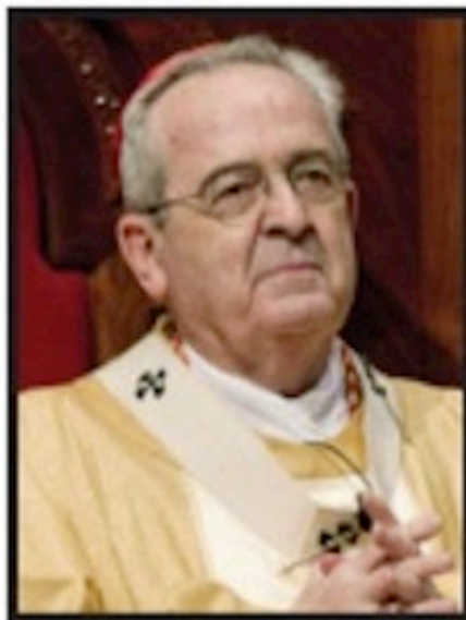
Justin Francis Rigali, archbishop emeritus of Philadelphia