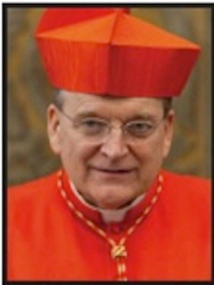
Raymond Leo Burke , prefect of the Supreme Tribunal of the Apostolic Signatura