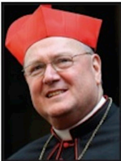
Timothy Michael Dolan , archbishop of New York