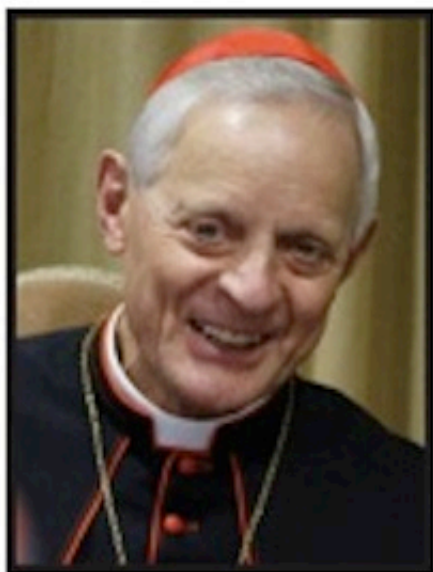
Donald William Wuerl, archbishop of Washington, D.C.