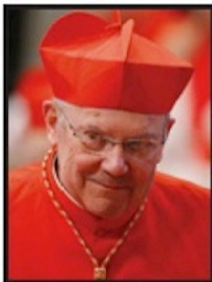
William Joseph Levada , prefect-emeritus of the Congregation for the Doctrine of the Faith