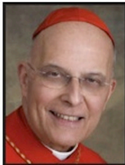
Francis Eugene George, O.M.I. , archbishop of Chicago