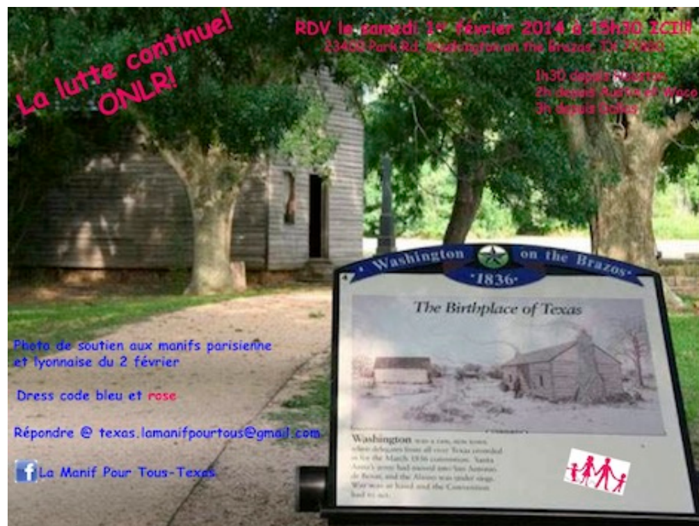
Photo de soutien aux manifs parisienne et lyonnaise du 2 février