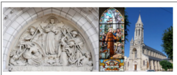
Les 11 - 12 et 13 juin 2016 – GRANDE FÊTE DE SAINT ANTOINE DE PADoue - PAROISSE LE CHESNAY