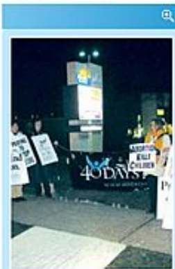
公教婦女會會員，在寒冷天氣下於卑詩婦女醫院外參與「40日維護生命」祈禱運動。